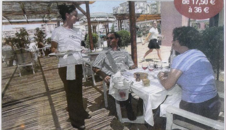
Le Bistrot d'Ariane installe sa terrasse au bord du bassin de Port Ariane, devant le tableau des embarcations alignées. Un beau dépaysement... loin de la mer.

Un site du bistrot-serie. En réalité, que sur la ténacité, sur la volonté d'installer une table dans un petit bistrot-brasero, voisin du modèle bouchon lyonnais, ce couple a marqué son site. Ainsi, c'est en fait les effets de ce site, et en suivant sans jamais une ligne directrice clairement définie, que se situe le succès du Bistrot d'Ariane, référence